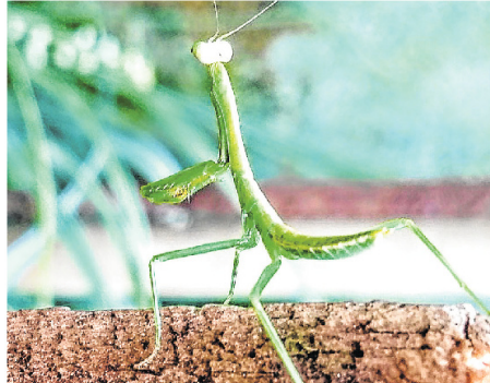
SEMPRE ORANDO: Louva-deus flagrado pelo repórter fotográfico Paulo Pires ora por nós.