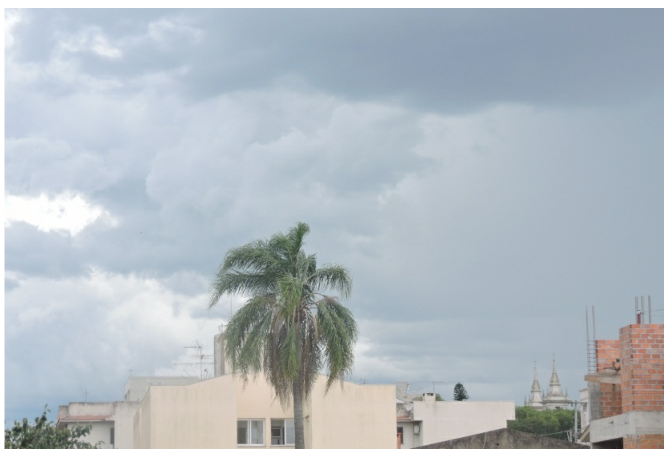
Nebulosidade é causada por massa de ar úmido

Boletim meteorológico emitido pela Sala de Situação da Secretaria do Meio Ambiente e Infraestrutura (Sema) nesta quarta-feira (27) destaca que os ventos que sopram do mar em direção a costa gaúcha são responsáveis por manter a nebulosidade mais carregada com chuviscos no litoral e regiões do entorno. No restante do estado tem sol com menor variação de nuvens. As temperaturas seguem amenas.