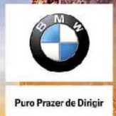
imagem meramente ilustrativa. Minha escolha faz a diferença no trânsito.

IESA Porto Alegre Av. Tarso Dutra, 285 51 3025 3030