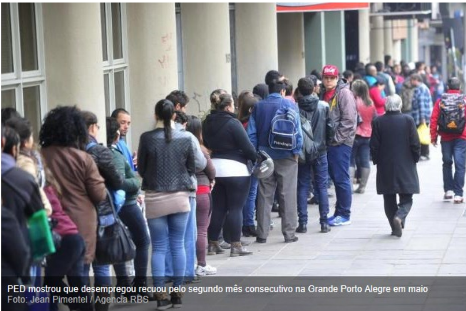
PED mostrou que desemprego recuou pelo segundo mês consecutivo na Grande Porto Alegre em maio

Após 24 anos sendo realizada todos os meses, a Pesquisa de Emprego e Desemprego na Região Metropolitana de Porto Alegre (PED-RMPA), o mapa mais completo do mercado de trabalho gaúcho, corre o risco de ser interrompida.