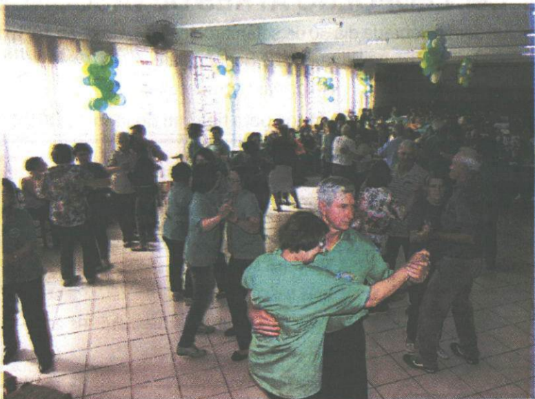
Confraternização incluiu almoço, gincana lúdica e dançaterapia social" enfatiza o prefeito.

O objetivo do evento foi promover no Dia do Idoso, através de uma amplitude de atividades,