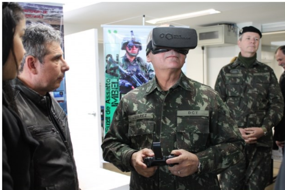
Tecnologia é um dos destaques do aglomerado de segurança

Polo tecnológico e referência no Ensino Superior gaúcho, o município de Santa Maria também é conhecido pela vocação militar, representando o segundo maior contingente do País, com 9,3 mil homens e 20 organizações. As características ajudam a explicar porque surgiu ali o APL Polo de Defesa e Segurança, reconhecido pelo governo estadual em 2015 e que hoje une 19 empresas, com forte interação com as Forças Armadas.