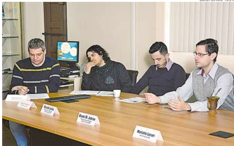
Economistas durante lançamento da 8ª edição do Panorama Internacional

A ampliação do corte ocorre em meio às reclamações de diversos órgãos que estariam estrangulados pela falta de recursos. Alguns deles, como as polícias Federal e Rodoviária Federal, chegaram a ameaçar paralisar seus serviços. O valor total do contingenciamento em vigor neste ano subirá para R$ 44,9 bilhões, superando inclusive o bloqueio inicial anunciado no fim de março, de R$ 42,1 bilhões.