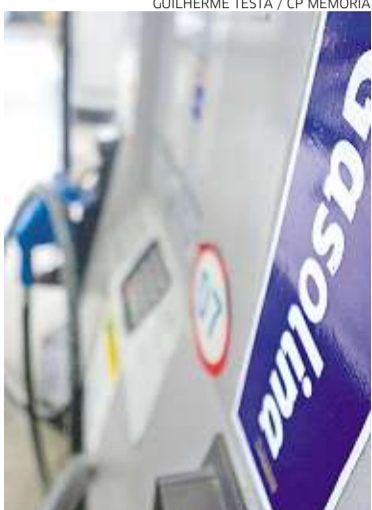
Diesel deve ficar R$ 0,21 mais caro

A alíquota do PIS/Cofins para a gasolina mais que dobrará, passando dos atuais R$ 0,38 por litro para R$ 0,79 por litro. A estimativa de arrecadação com o