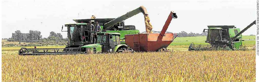
CLAUDIO GOTTREID ESPERAN, B0 09/02/2017

Colheita de 2017 (foto) recuperou perdas provocadas pelas chuvas no ano passado