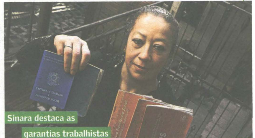
Sinara destaca as garantias trabalhistas

Em fevereiro deste ano, o salário da categoria teve aumento de 9,6%, chegando a R$ 1.103,66 por 44h semanais. Entre as mudanças na nova legislação, inclui-se a fixação de limite de jornada de trabalho em até 44 horas semanais e pagamento de horas extras.