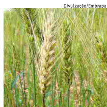
Trigo afetado pela gibberella

Produtores rurais do norte do RS exportam trigo contaminado para países da Ásia e da África