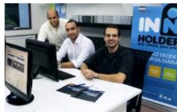
Sócios da InnHolder.

A InnHolder , empresa incubada na Raiar da PUC-RS, promete oferecer um serviço inovador para os turistas pelo Brasil. O conceito "Your choice, your price" permite que o hóspede aponte quanto quer pagar pela sua estadia.