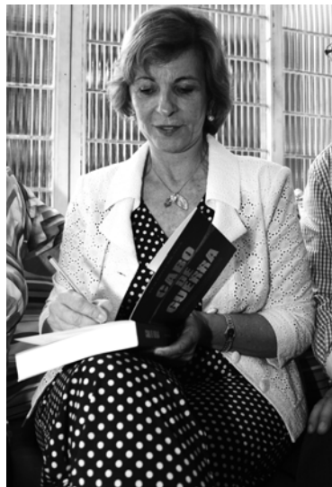
Yeda autografou livros para fãs

mento acabou quando o News of the World encerrou suas atividades no passado, justamente por pregar esse tipo de procedimento. "A mídia teve de apresentar nova carta de ética. Infelizmente estava naquela cadeira naquela época. Agora, estamos vivendo mais em paz", esclarece.